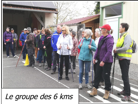
Le groupe des 6 kms

Une soixantaine de marcheurs ont participé à la randonnée annuelle.